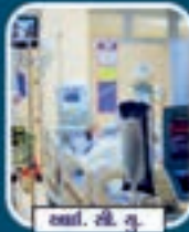
આઈ. વી. એફ.

Interventional - Cardiology, Neurology and Vascular Surgery