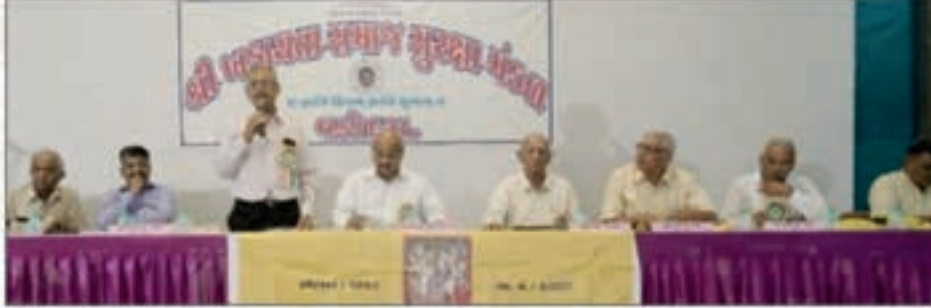
ખડાયતા સમાજ સુરક્ષા મંડળના માનવંતા ટ્રસ્ટીશ્રીઓ