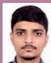
Deep Mendapara UNIVERSITY OF OTTAWA