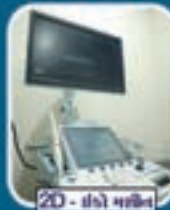
2D - ઇમેજ મશીન