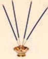
જન્મ તારીખ ૩૧ માર્ચ, ૧૯૪૦