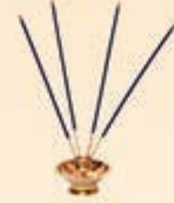
શ્રીગુચરણ ૧૭ ઓક્ટોબર, ૨૦૨૧