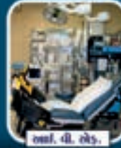
આઈ. વી. એફ.