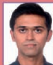
Meet Dalsaniya UNIVERSITY OF WINDSOR